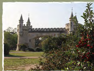
Parque Pereyra Iraola

Fue un gran sacerdote reflejo de humildad y pasó su vida ocupándose de los pobres y afligidos.