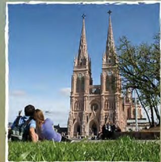
Basílica de Lujan