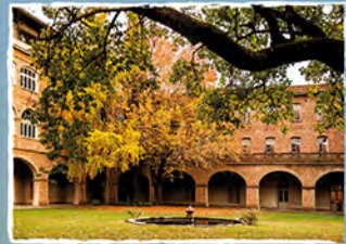
San Miguel, Colegio Máximo

Un rasgo típico que lo caracterizó es la apertura de su corazón. Cuando ibas a verlo, estuviera donde estuviera y con el trabajo que tuviera, te hacía sentir que vos eras el único. Estaba siempre a disposición de los demás.