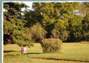
La Armonía, Mar Chiquita

Transmitió siempre su alegría, vivió lo que predicó. Hombre de profunda oración, tenía una gran devoción a la Santísima Virgen María. A impulsos de una fe viva, de una esperanza firme y de un amor grande y generoso, vivió el sacerdocio en plenitud conociendo, amando y construyendo la tierra.